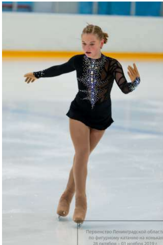
Первенство Ленинградской области по фигурному катанию на коньках 28 октября – 01 ноября 2019 г.