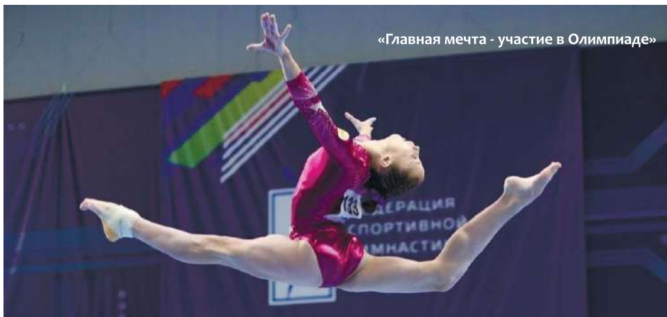
«Главная мечта - участие в Олимпиаде»

На этом спортивные успехи не закончились. В ноябре этого же года гатчинская гимнастка завоевала три медали на Всероссийских соревнованиях на Кубок Губернатора Калужской области. Копилка спортсменки пополнилась золотой и двумя бронзовыми медалями.